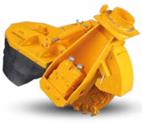
SCE-800H Pour pelles entre 10 et 30 tonnes