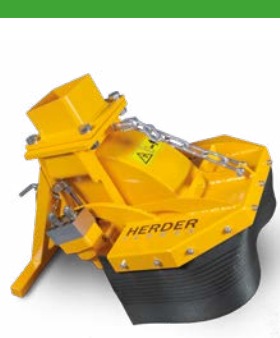
SCE-410H Pour pelles entre 3 et 8 tonnes