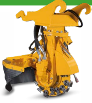
SCE-550H Pour pelles entre 7 et 20 tonnes