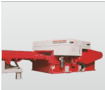
Série broyeurs RHZ 300 - RHZ 1300 S : Avec alimentation horizontale de la machine