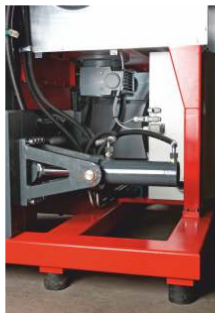
Vérin hydraulique puissant, Moteur réducteur pour l'axe mélangeur et la vis d'alimentation