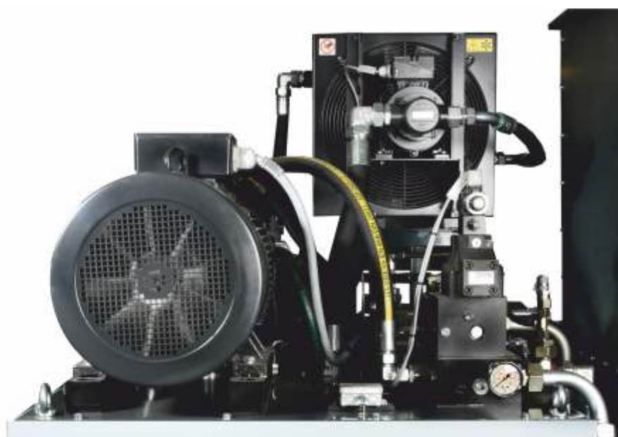
Centrale hydraulique équipée d'une pompe à piston et un système de refroidissement pour une production en plusieurs postes

Laissez-vous conseiller de quelle manière optimale votre matière peut être valorisée en briquettes.