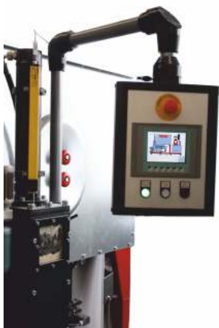
Ecran tactile de commande et de programmation de la presse à briquettes