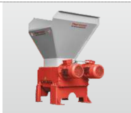
Série RMZ 500 - RMZ 1000 S : Broyeur à quatre axes, idéal pour le broyage d'éléments longs à faible section