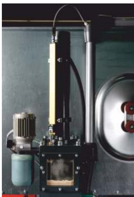
Système de contrôle et de mesure des déplacements des tiges de vérins et de la matrice de compression. A côté le module pour le graissage centralisé.