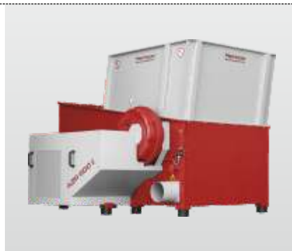
Série AZR 800 - AZR 2000 Gigant : Broyeur mono rotor pour le broyage professionnel de matériaux