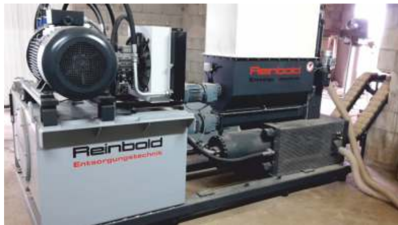
RB 600 RS avec auge d'alimentation sous silo