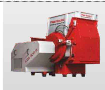
Série AZR 600 K - AZR 2000 K Gigant : Broyeur à mono rotor pour le broyage efficace des matières plastiques