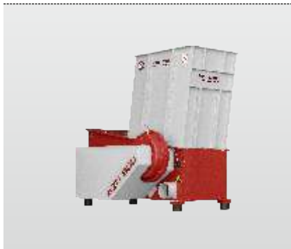
Série AZR 600 : Broyeur universel pour menuiseries