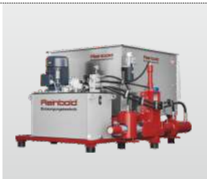
Série RB 100 – RB 300 Flexibel S : Pour une production journalière plus impor- tante de briquettes à partir de copeaux et de sciure

Fort de sa longue expérience dans le broyage de matériaux et le compactage de briquettes, Reinbold propose avec sa vaste gamme de machines des solutions optimales pour les applications les plus variées de broyage et de compactage en briquettes. Nos techniciens sont à votre disposition pour réaliser un essai avec vos matières.